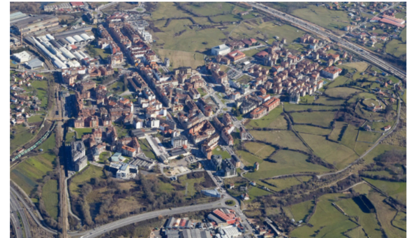
Agenda Urbana de Siero

Este plan tiene como objetivo definir las principales líneas de actuación que ya venían enmarcadas en la Agenda Urbana de Siero , aprobada en 2024.