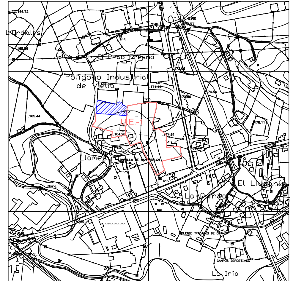
PGOU DEL EMPLAZAMIENTO