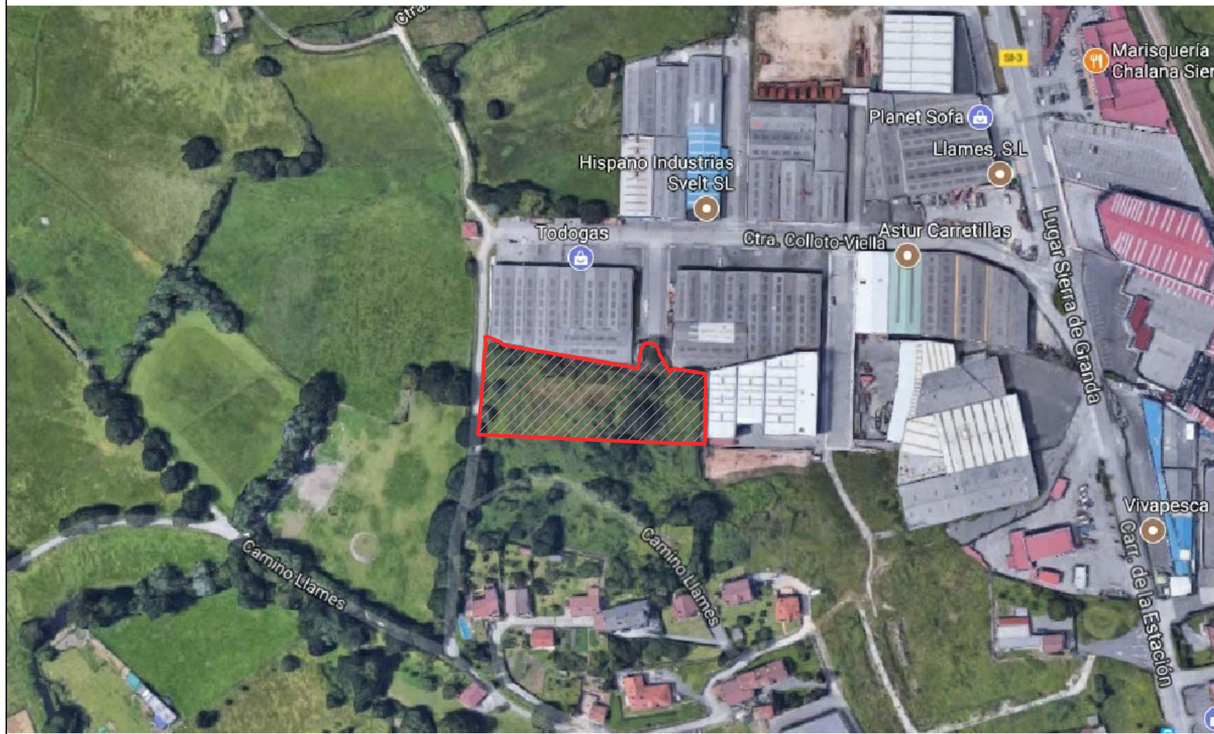
VISTA SATELITE DE LA ACTUACIÓN